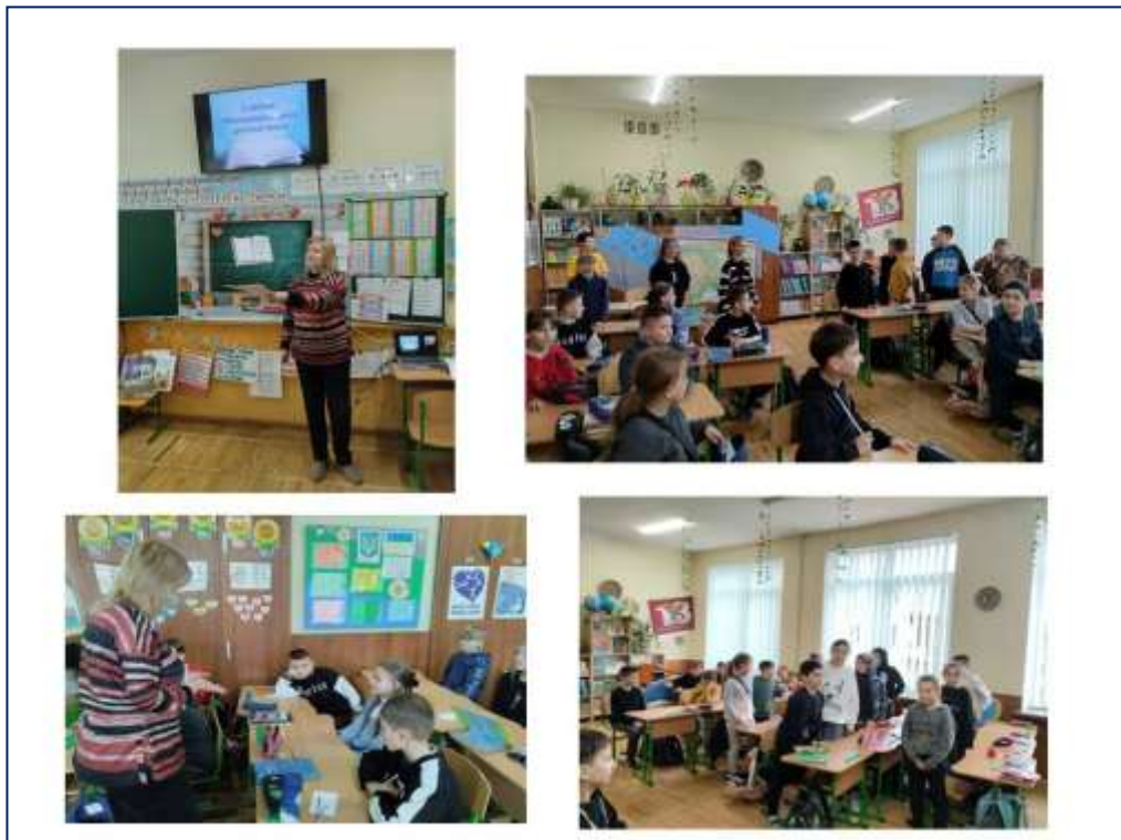
Міжнародний день книги