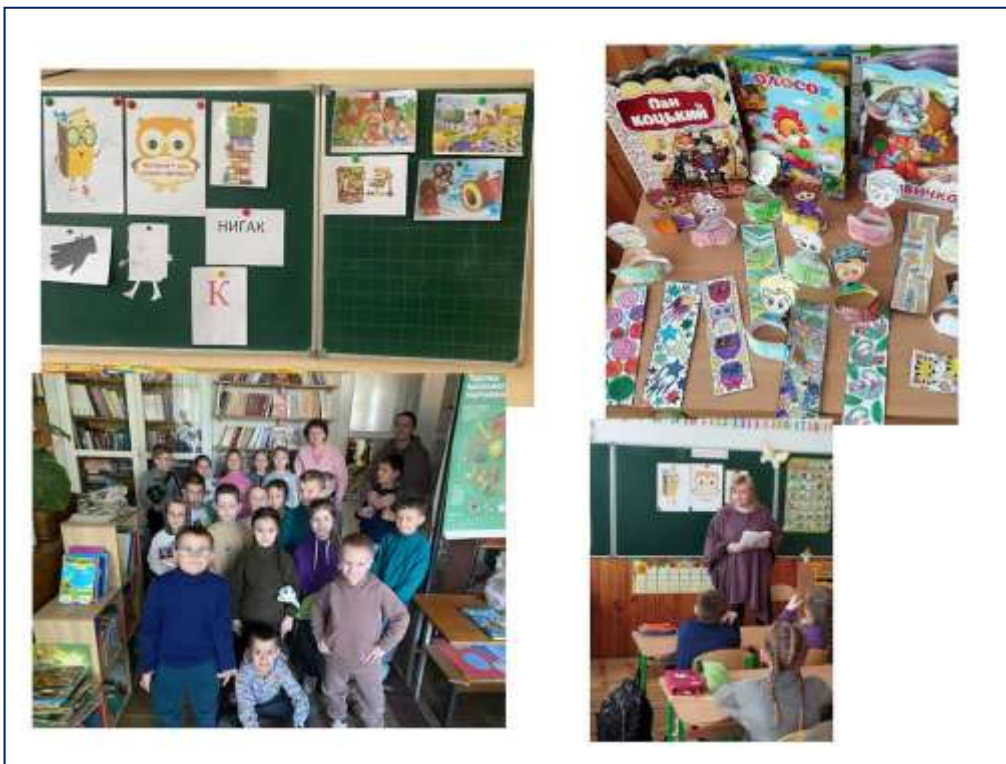
Навчаємося читати з героями казок «Що за чудо ці казки?»