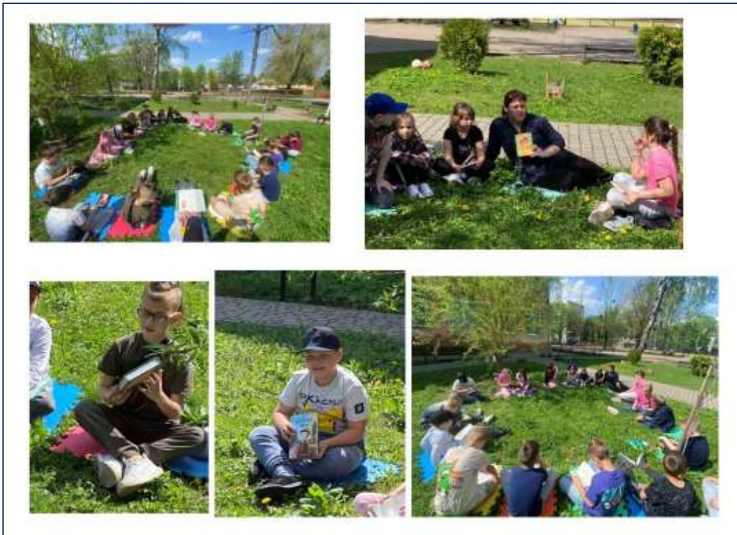
Читання на природі у Всесвітній день книги