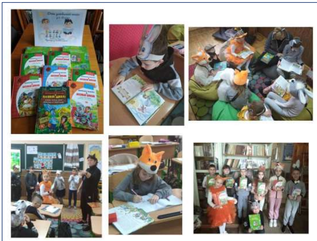
День улюбленої книги «Незвичайні пригоди у лісовій школі» В. Нестайка. Магія перевтілення в героїв пригод.