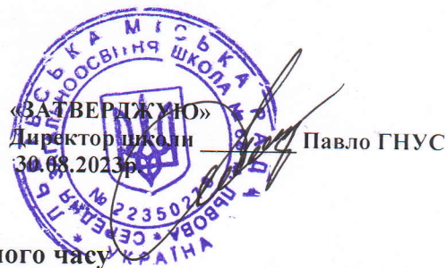
Таблиця розподілу навчального часу для 5-х загальноосвітніх класів СЗШ № 68 на 2023-2024н.р.

«Погоджено» Педагогічна рада школи Протокол №_1__ від _30.08.2023р.