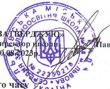
Таблиця розподілу навчального часу для 6-х загальноосвітніх класів СЗШ № 68 на 2023-2024н.р.