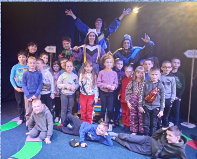
У креативному театрі ОКО