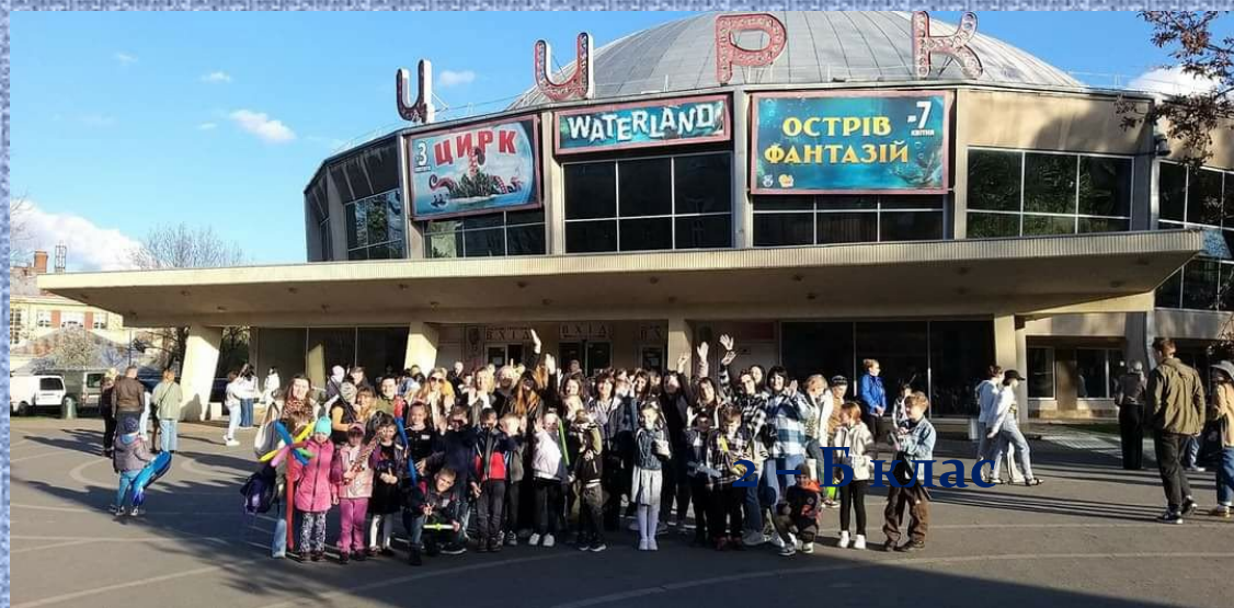
У Львівському цирку