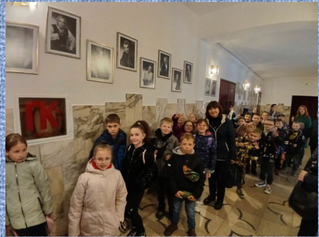
У І Українському дитячому театрі