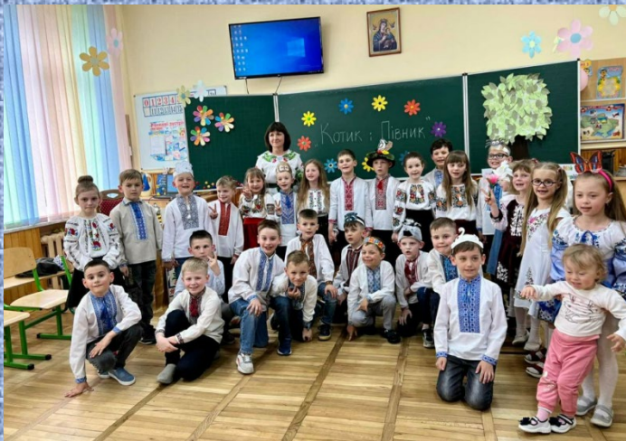
Казка «Котик і Півник»