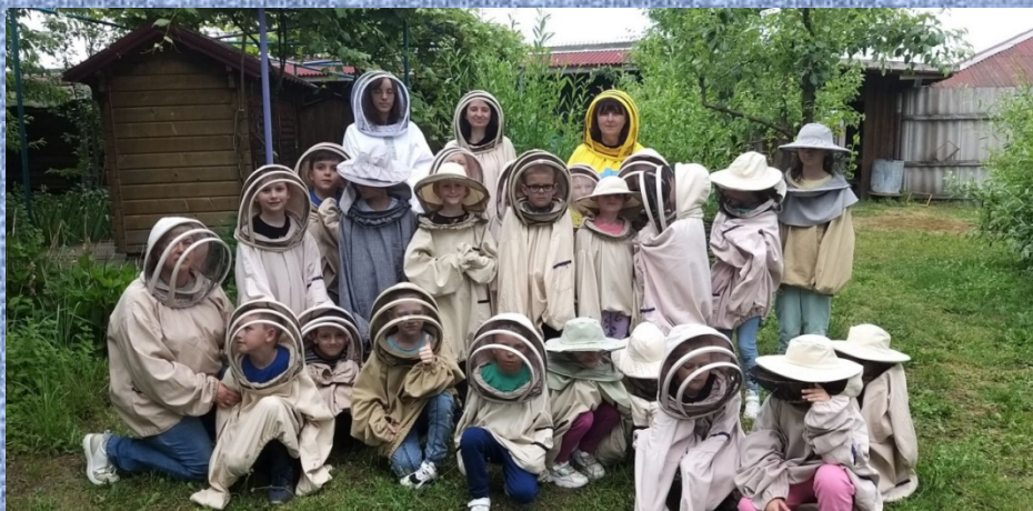
Пасіка «Медовий блюз»