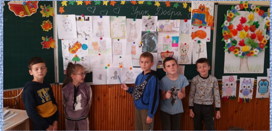
2 – Б клас