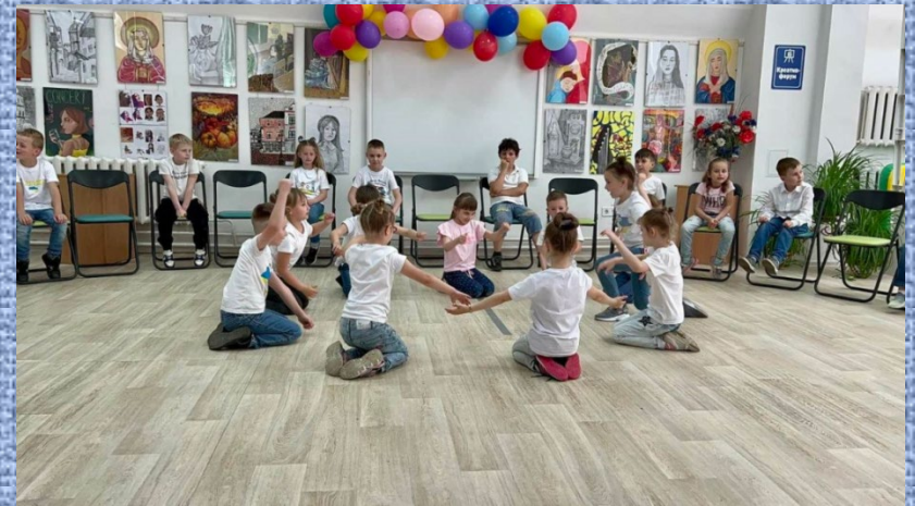
Свято «Бувай, Перший клас»