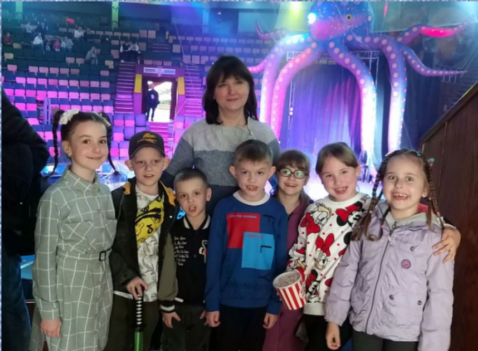
Барвиста вистава у цирку