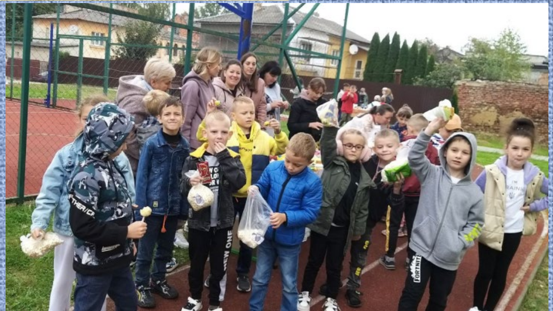
Участь у шкільному ярмарку