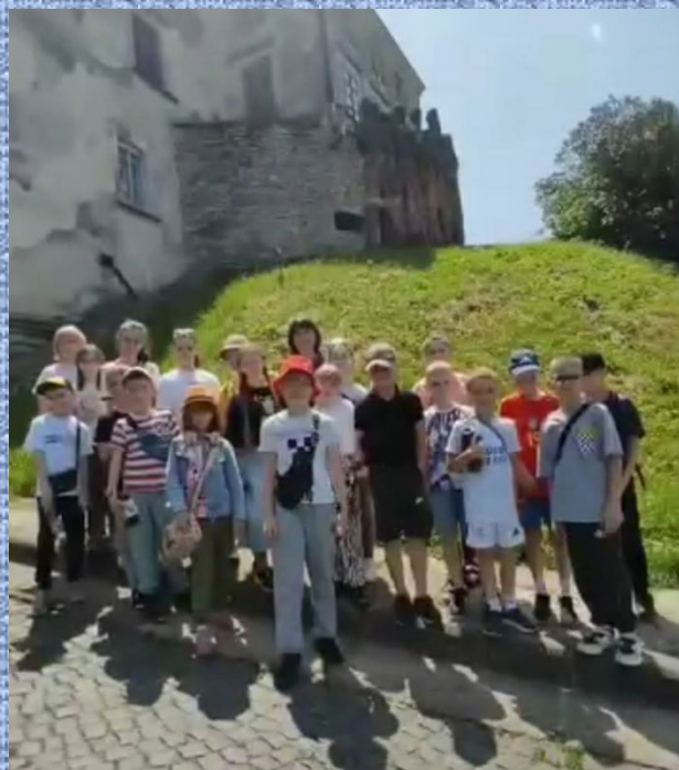
В Олеському замку