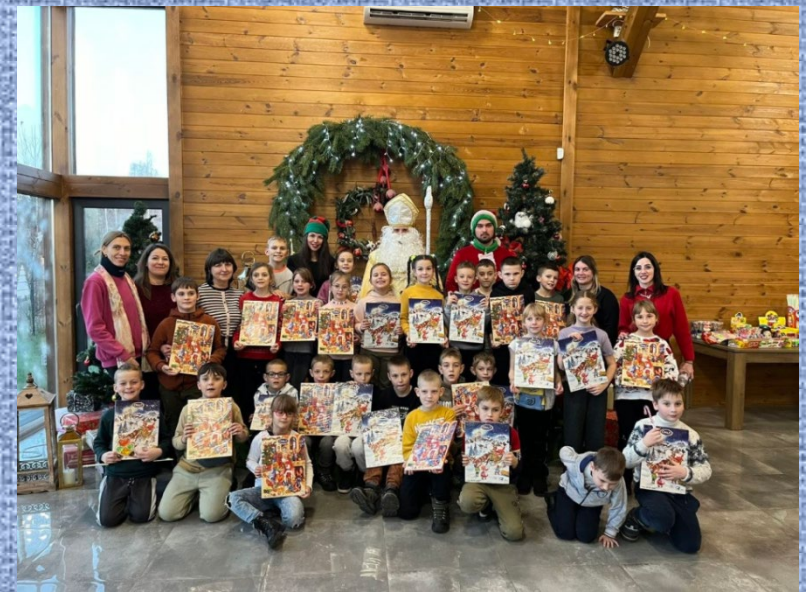
У резиденції Святого Миколая