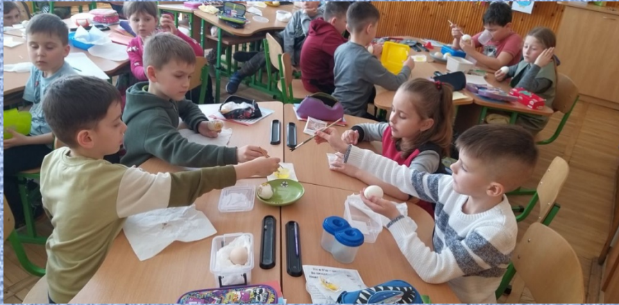
Виготовлення писаночок, 2 клас