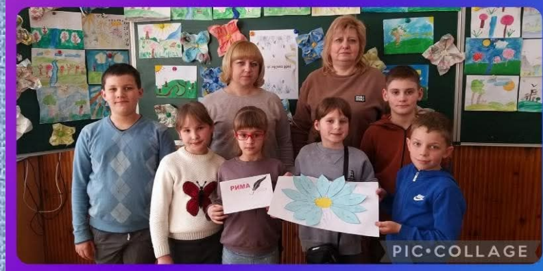
Вікторина «Поезія – це музика душі», 3 – Б