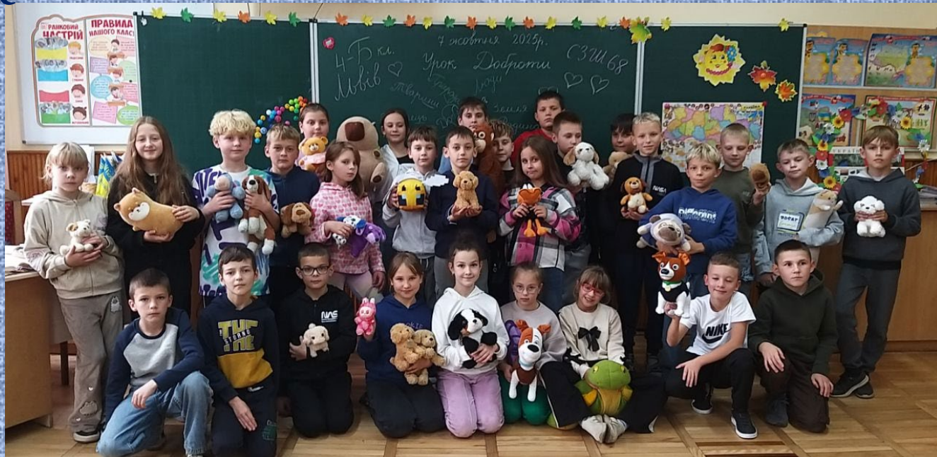
4 – Б клас