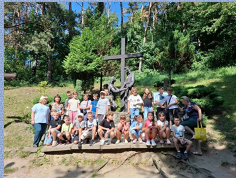
Хресна дорога у с. Страдч