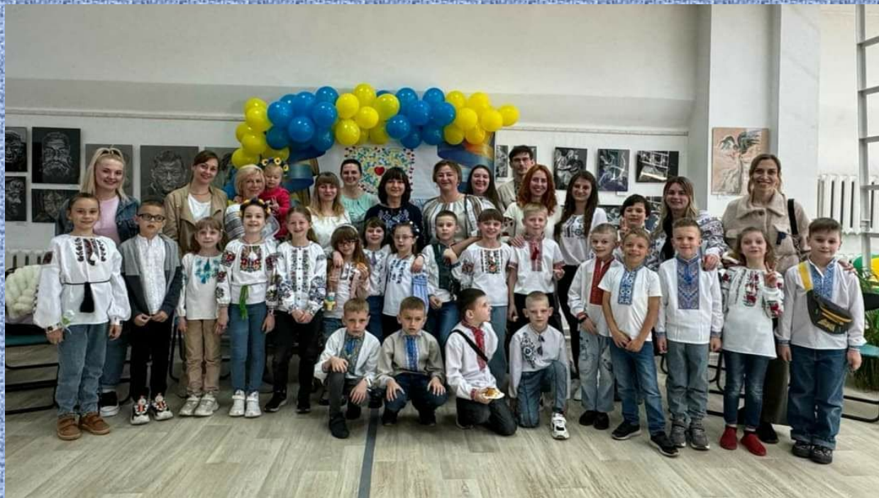
Свято Весни, 2 - Б