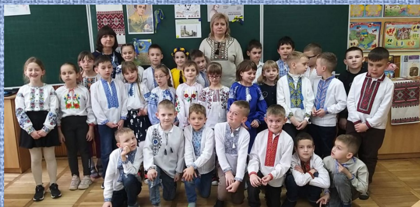
Конкурс на кращого читця поезій Тараса Шевченка