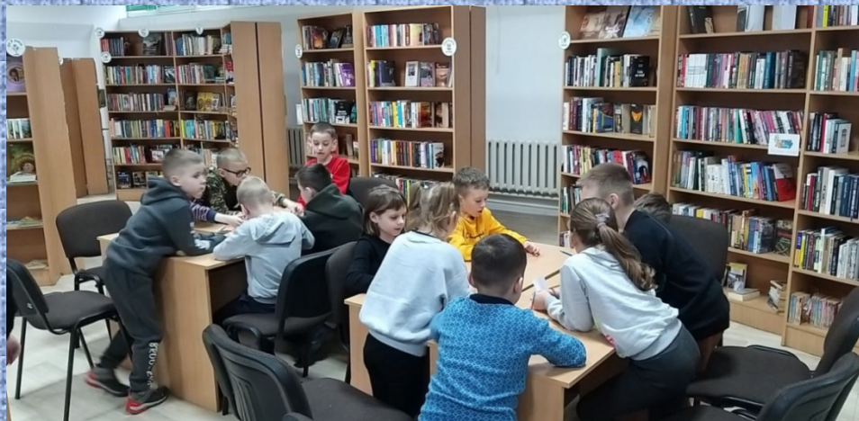
Комфорт - бібліотека 42