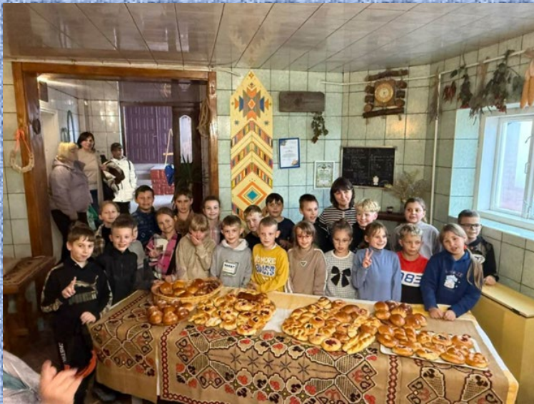
Випікання піци та булочок, 4 кл.