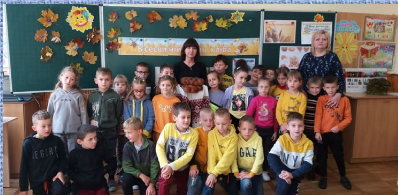
«День хліба» у 2 – Б