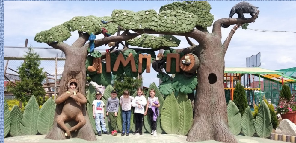
У зоопарку «Лімпо», с.Меденичі