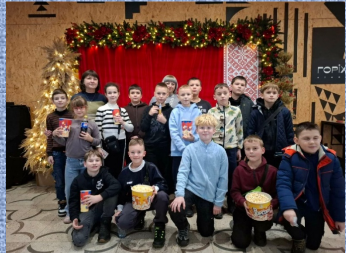
Улюблений к - р «Горіховий гай»