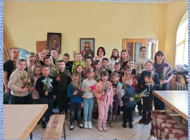
Виготовлення вербових букетиків у храмі св. Арх. Михаїла