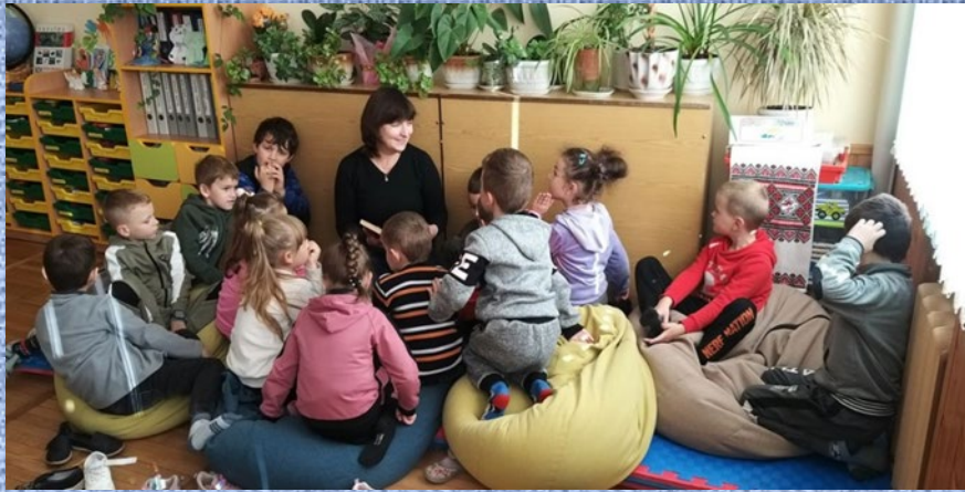
1 – Б клас