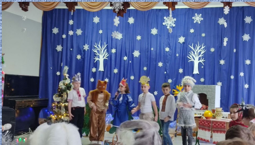
Свято «Новорічний Колобок»