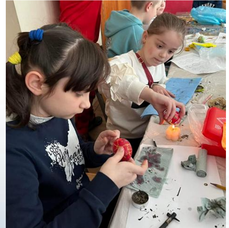
4 кл. Майстер клас «Великодня писанка»