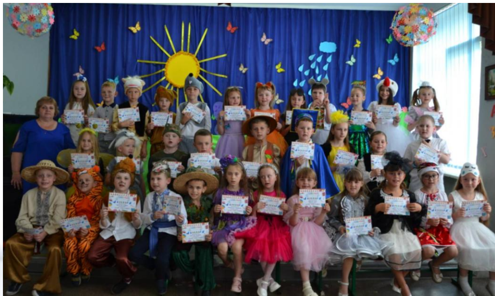
1 кл. Свято «Прощавай, Букваріку»