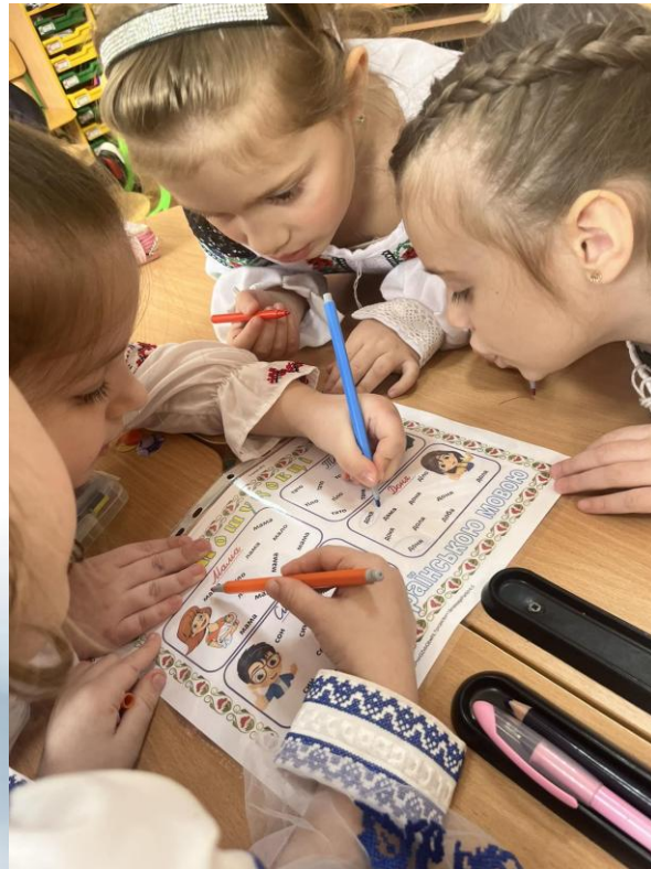
Квест «Цікавинки рідної мови» 2024р.