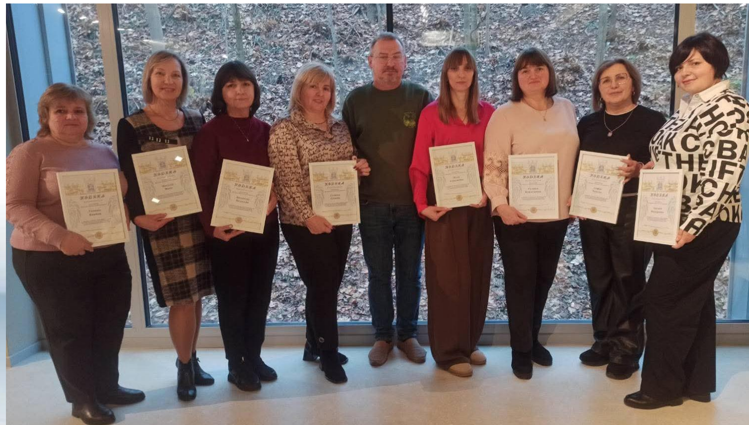
Участь та перемога у програмі «Педагоги, які надихають». 2025р.