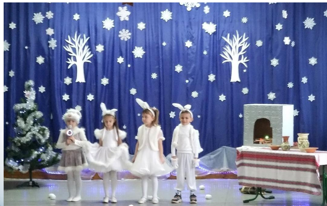
1 кл. Свято «Новорічний Колобок»