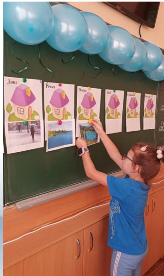
1 клас ЯДС Кольоровий тиждень . «Синій колір. Вода»