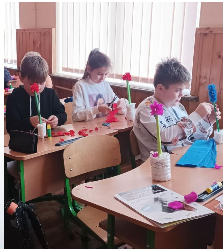
4 кл. ЯДС «Подарунок для матері»