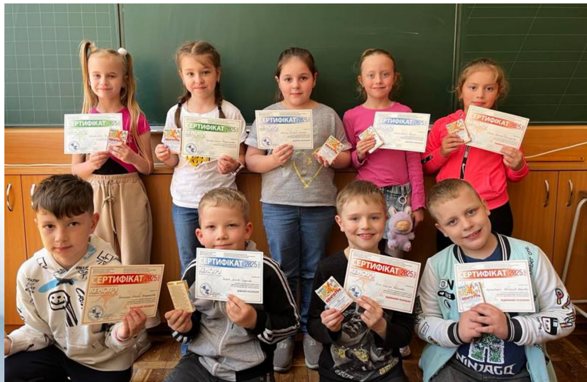
Участь у конкурсі «Кенгуру»