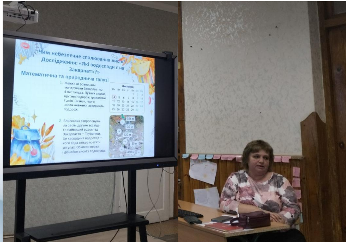
Виступ на педраді. «Інтеграція навчального процесу в початковій школі.» 2025р.