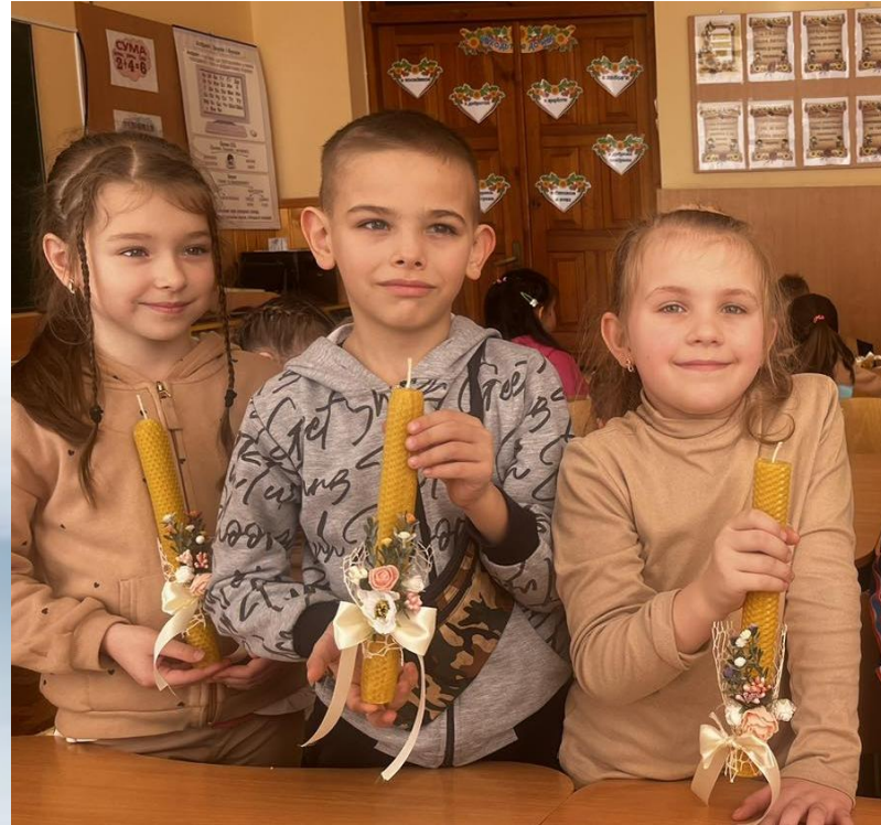
2 кл. Майстер – клас «Стрітенська свічка»