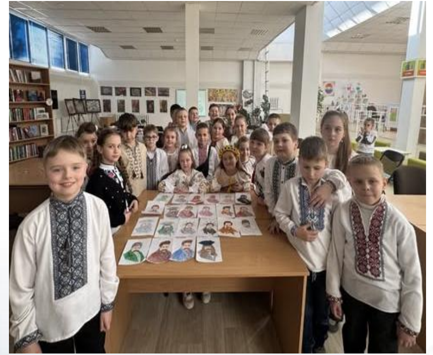
3 кл. "Поклонися, земле, пам'яті Тараса"