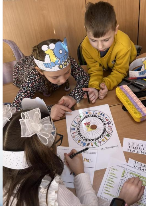
1кл. Урок - свято «100 днів у школі»