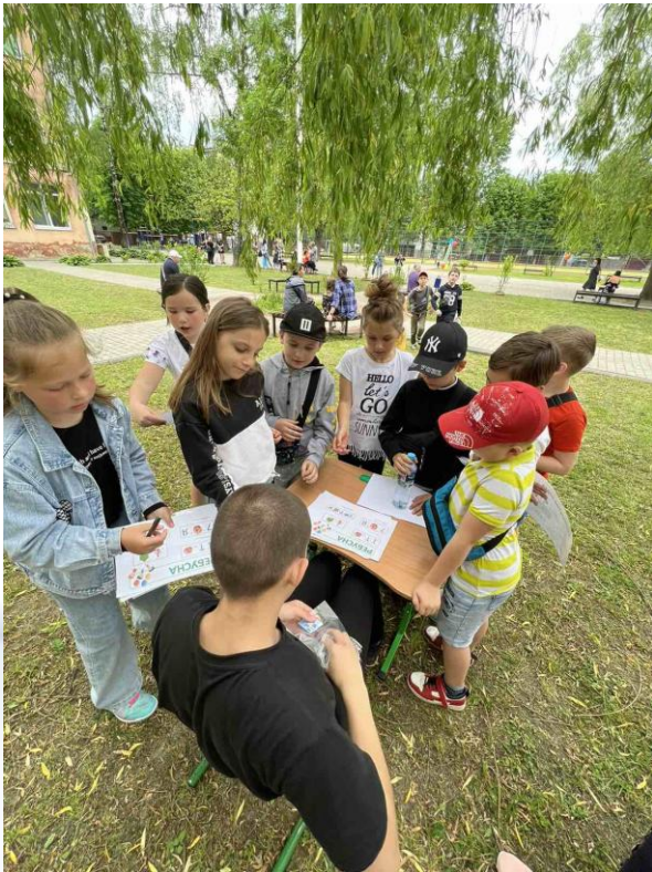
Квест до «Всесвітнього дня дитини» 2022р.