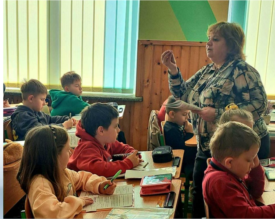
3 кл. Українська мова «Дивовижні пригоди. Редагування тексту.»