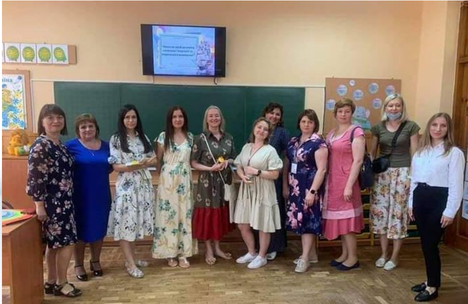
Всеукраїнський семінар ( за сприянням ГС Освіторія, Києво – Могилянської бізнес – школи, УО ДТІП) 16 червня 2021р.