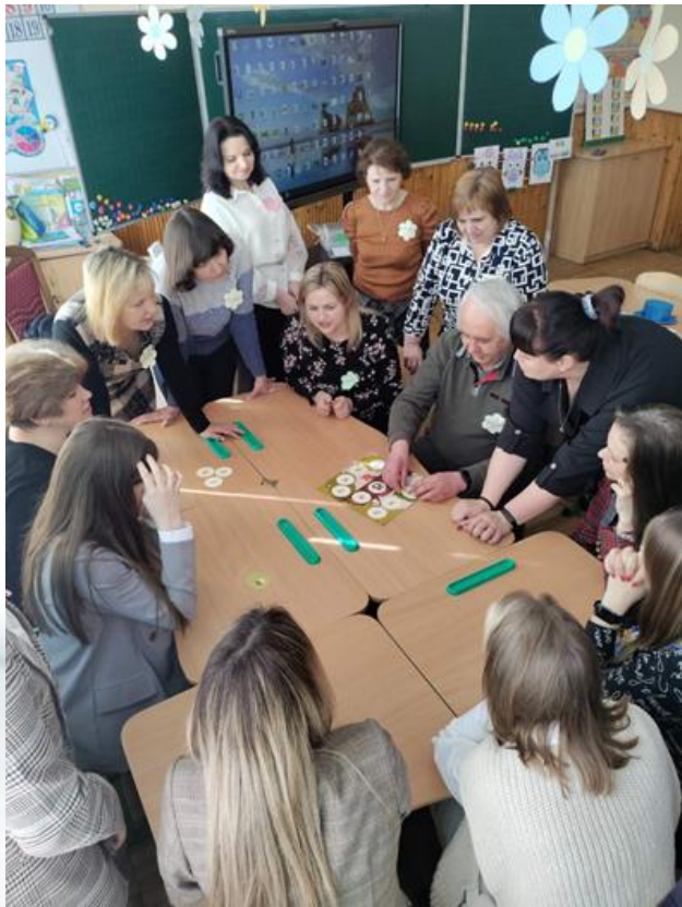
Семінар - практикум з викладачами кафедри початкової та дошкільної освіти ЛНУ ім. І. Франка 2023р.