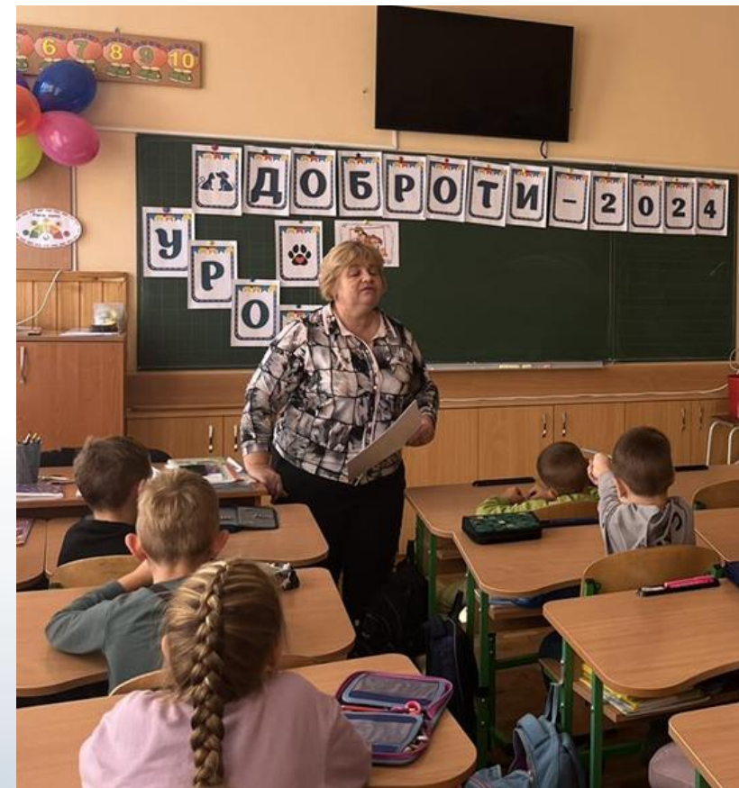
«Урок доброти» 2024р.