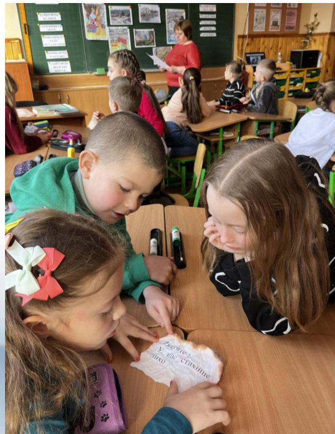
2 кл. День цивільного захисту. «Дії під час надзвичайних ситуацій»