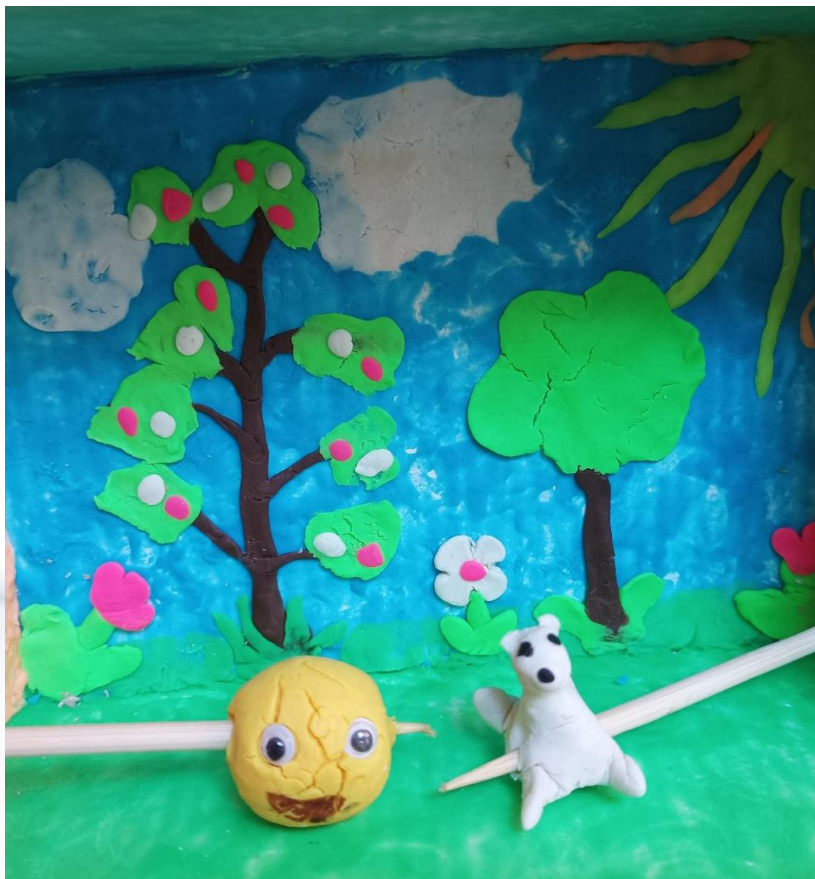
2кл. Українська мова «Мультфільм в коробці»