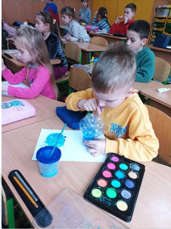
2 кл. Створимо разом .«Малювання за допомогою мильних бульбашок»