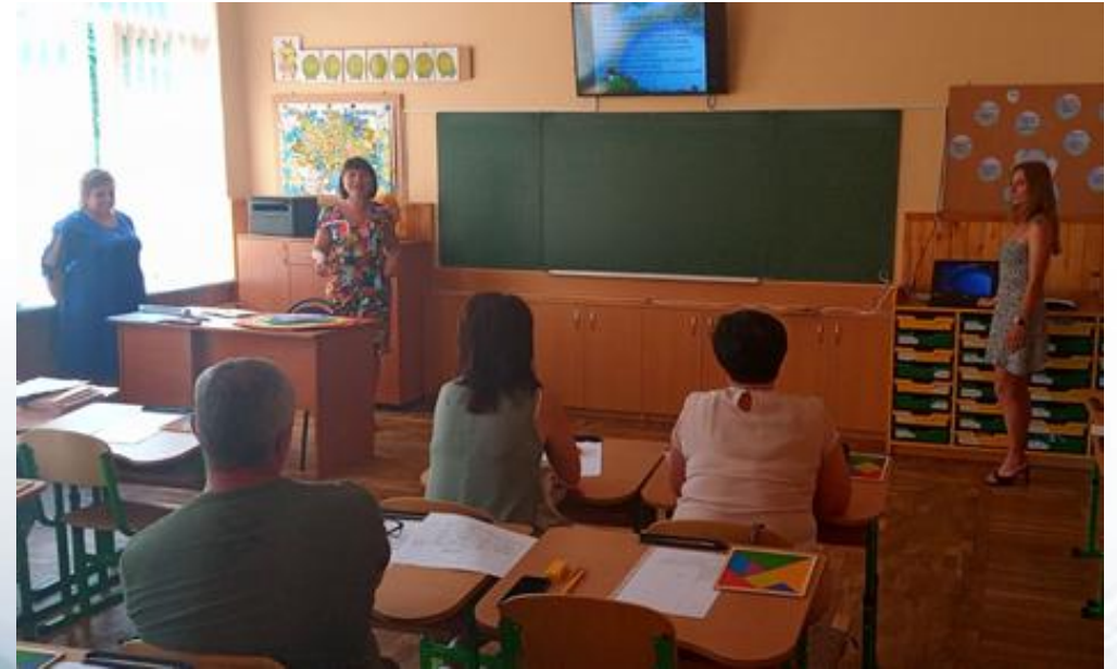
Канадсько-український семінар. 7 липня 2021р