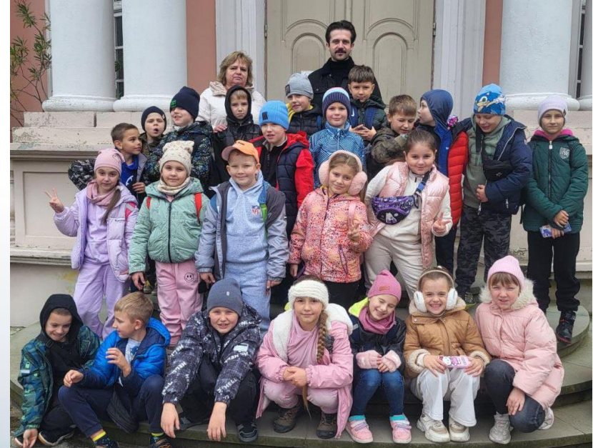
3 кл. Урок – подорож «Тіємниці та легенди Золочівського замку»