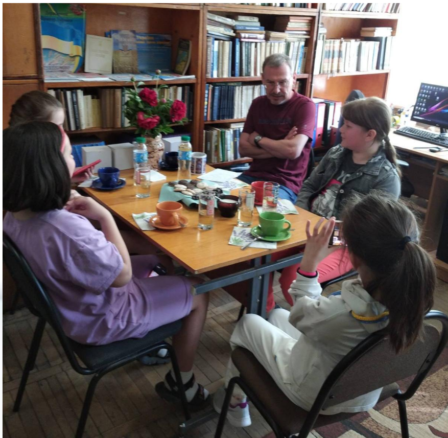
4 кл. Українська мова Проект «Моя школа»