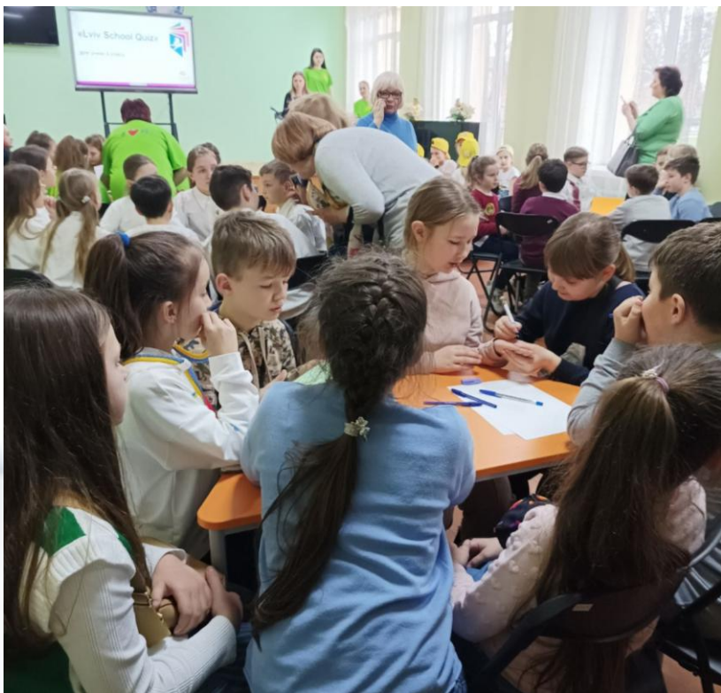
Участь у районному квізі. 2023р.