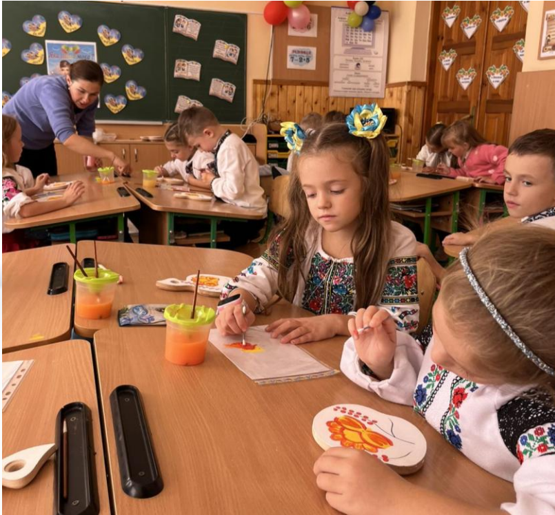
2 кл. Майстер – клас « Декоративний розпис рідного краю»