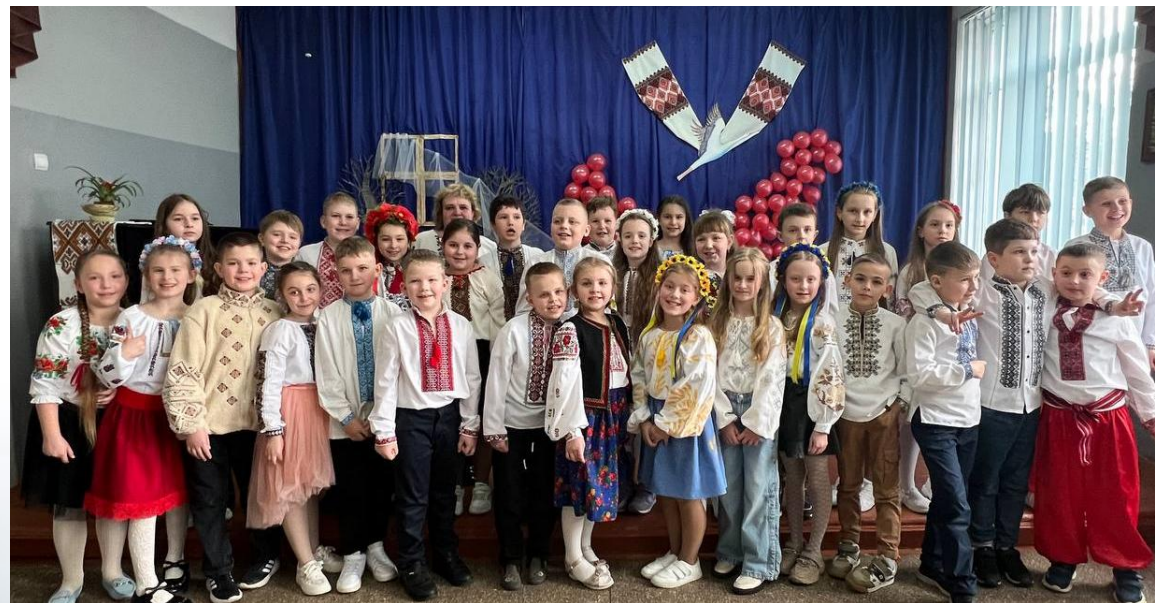
3 кл. Свято «А у нас в Україні»