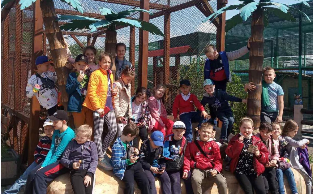
4 кл. Урок - екскурсія в зоопарк с. Меденичі