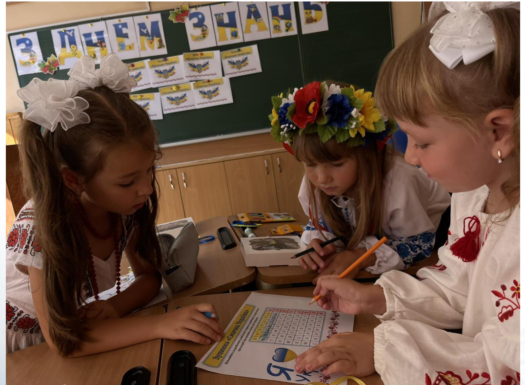
Квест «Я люблю Україну» 2025р.