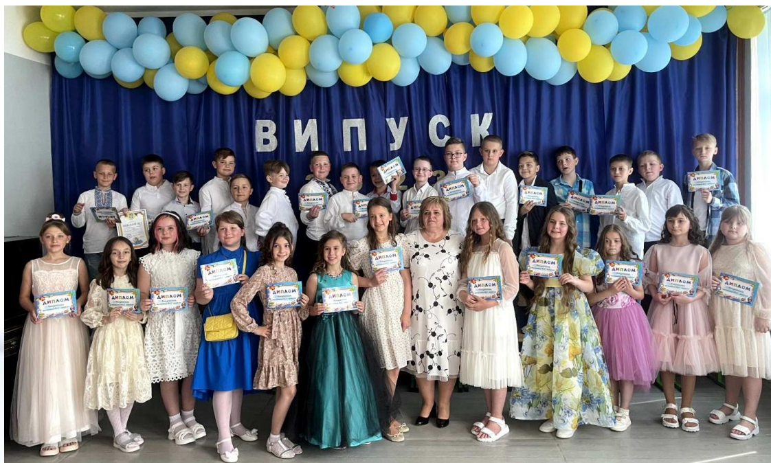
4 кл. Свято «Прощавай, початкова школо!»