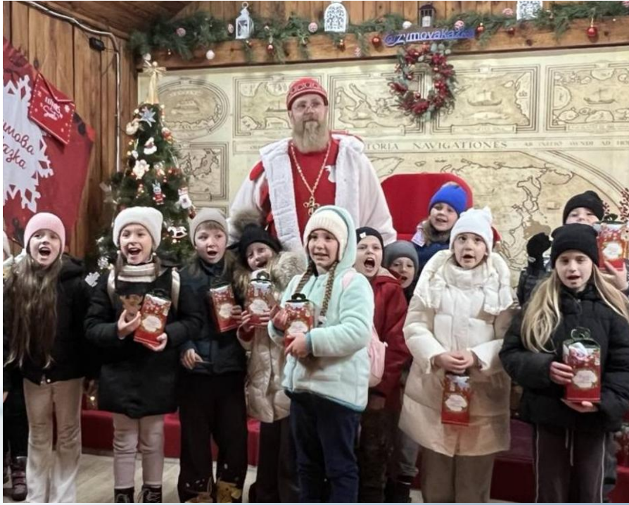
Урок - подорож «У пошуках Святого Миколая»