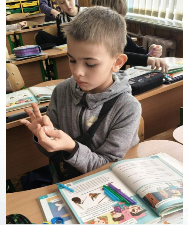
3 кл. ЯДС «Голоси вітру»